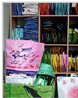
Des accessoires solides, joyeux et mode: c'est coll-part.

Et la Suisse? «J'aime aussi beaucoup la Suisse. L'idéal, ce serait de faire six mois ici, six mois là-bas... à condition que je puisse un jour me permettre